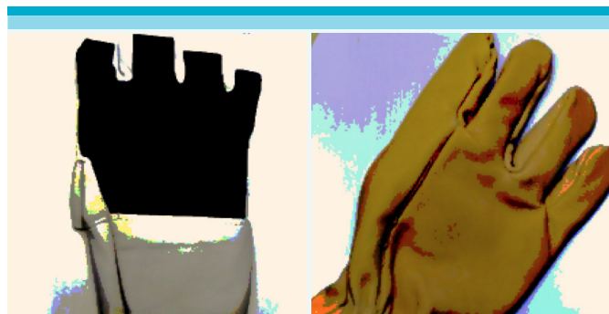
Figura 1: Tipos de guantes puestos a prueba por los trabajadores.

Se invitó a treinta (30) trabajadores a participar al estudio utilizando dos tipos de guantes antivibratorios durante una semana cada uno. Según el fabricante, estos guantes contienen burbujas de aire, lo que los convierte en antivibratorios. El modelo A cubre los dedos hasta la mitad, asegura la muñeca y está hecho de nailon en la parte superior y de cuero en la parte de la palma de la mano. El modelo B cubre los dedos por completo y es de cuero (Figura 1).